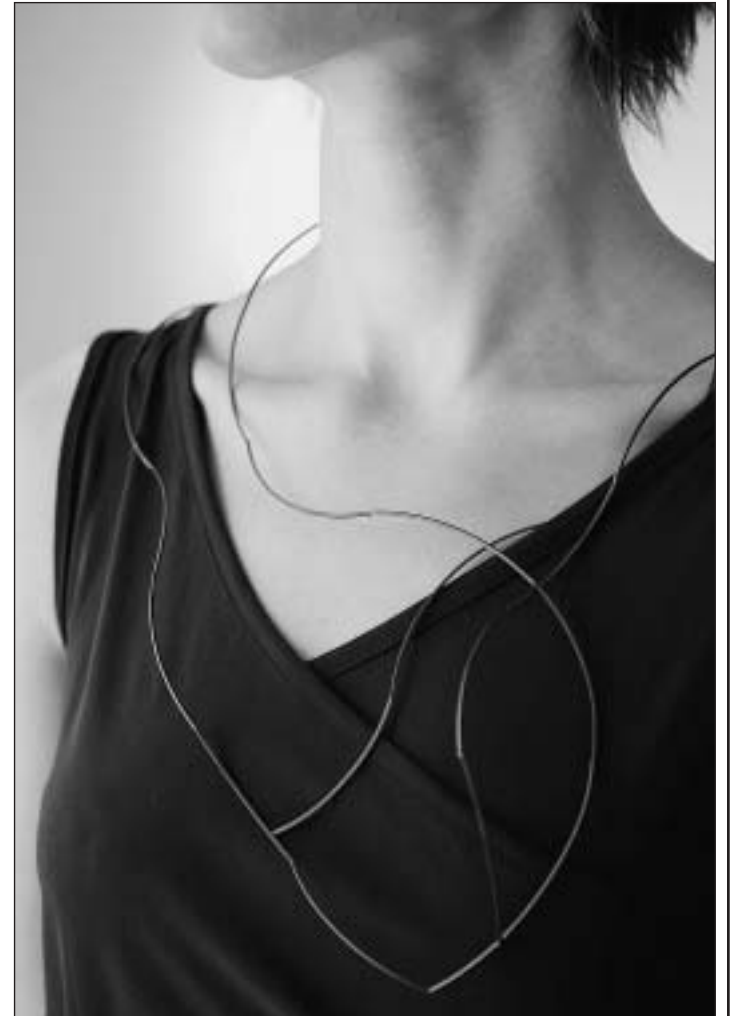
Comme le mouvement, les matières sont originales.

tant renouvellement. Après le cercle, elle a décliné les cubes et les carrés pour confectionner des broches souples, des boucles d'oreilles assorties ou des bagues volumineuses. Dans l'une de celles-ci, un tiroir découvre un miroir: « Ma bague porte-bon-