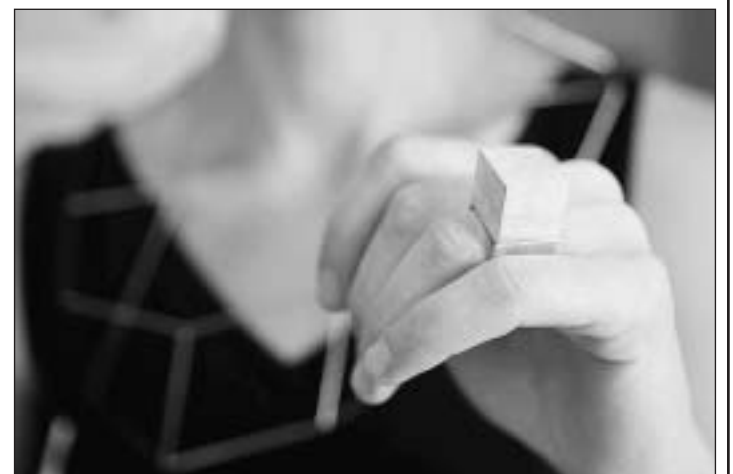
Même s'ils ne paraissent pas très ergonomiques, «mes bijoux se portent bien, s'ils sont ajustés».

heur». Une broche contient une lettre d'amour à demi brûlée, pour la Saint-Valentin.